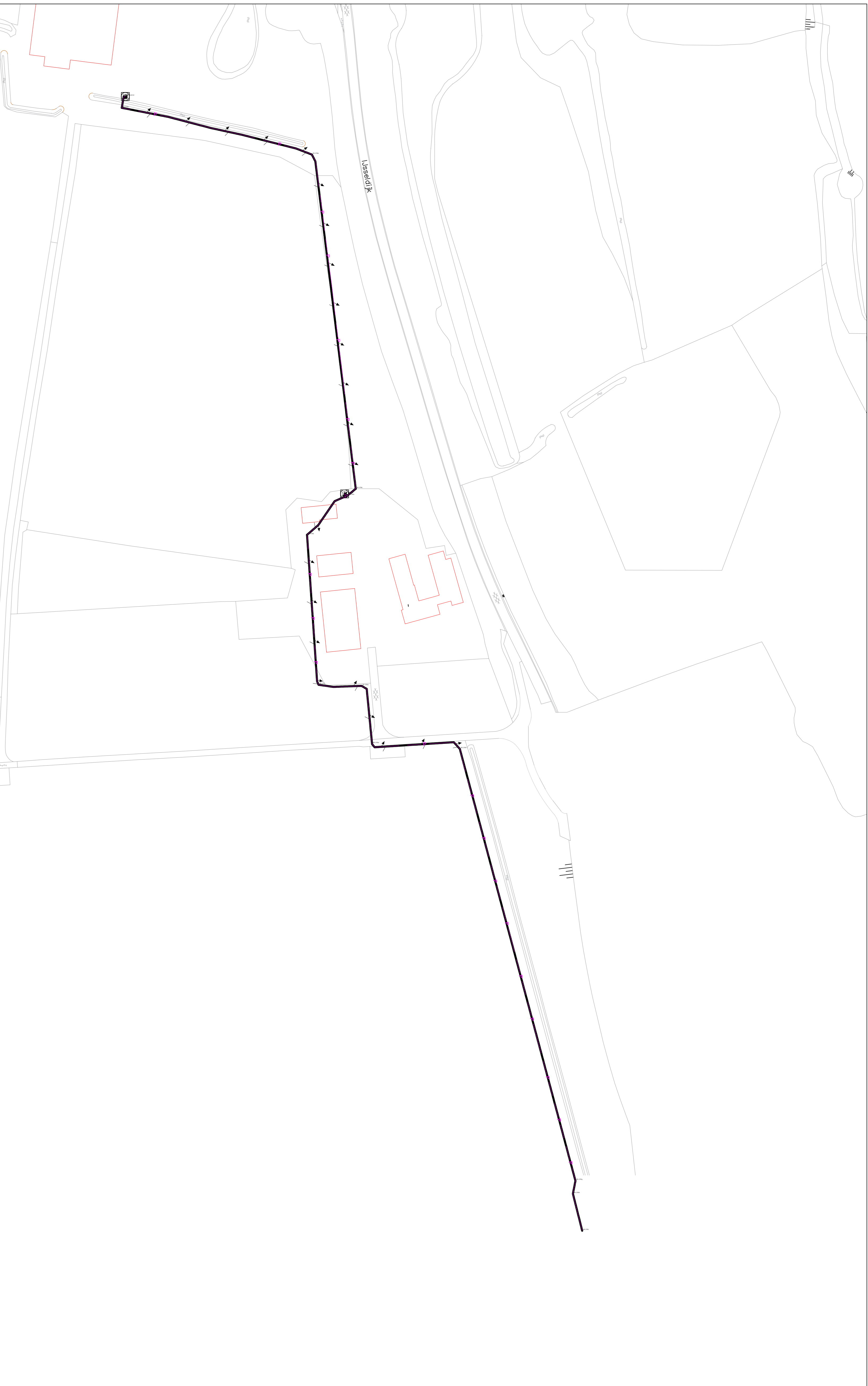
Overzicht Schaal 1: 1000 Tekening 039b